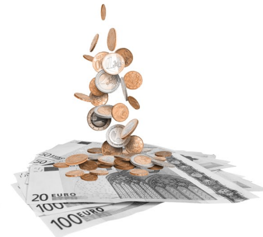
Bares Geld sparen