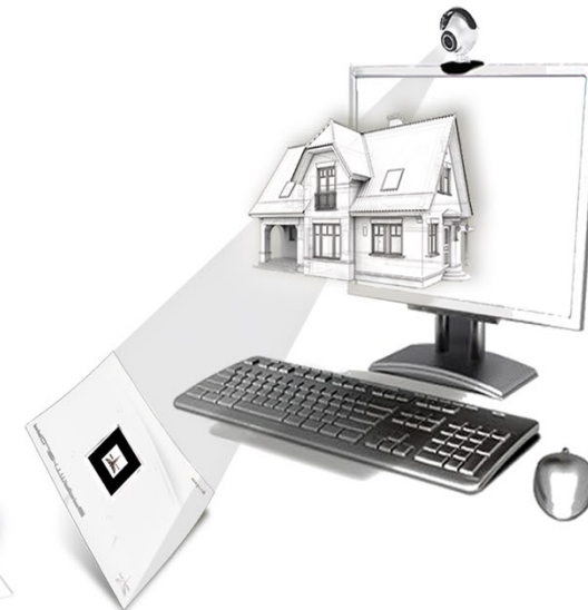
Projektmappe mit AR-Modell