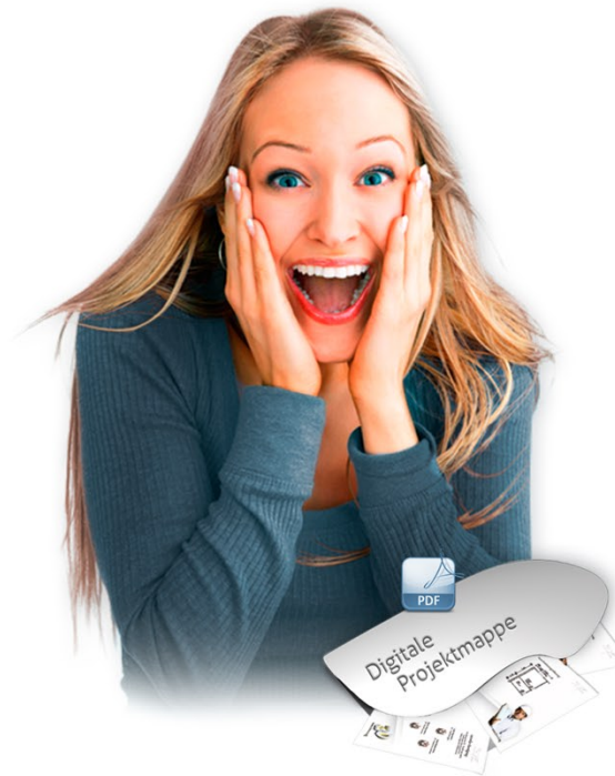
Begeisterung beim Kunden